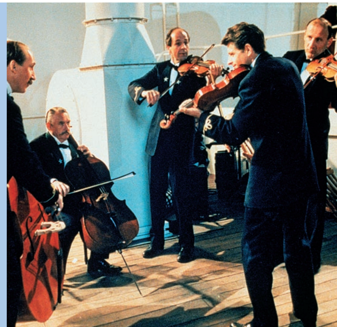
I Salonisti auf der Titanic im gleichnamigen Film (11 Oscars!) von 1997.