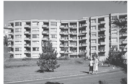
Seniorenresidenz Talgut, Haus 22