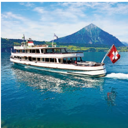
Halbtagesausflug an den Thunersee

➔ Am 9. des jeweiligen Monats werden am Abend im Arcadia 3 Wertgutscheine verlost im Gesamtbetrag von CHF 600.– (Beginn 9.3.–9.12.18)