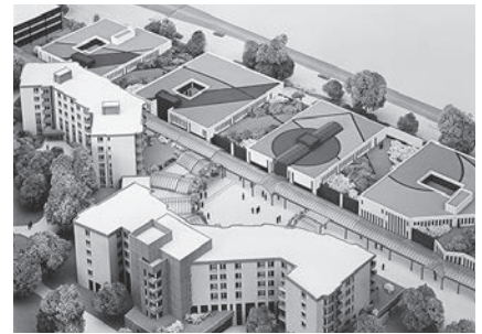
Talgut-Zentrum 1988 (Modell)