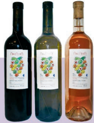
Jubiläumswein mit der Künstler-Etikette von Ted Scapa