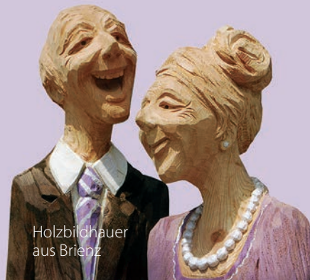
Holzbildhauer aus Brienz

Sie feiern im Jubiläums-Jahr 2018 selber ein Jubiläum? Die ersten 30 Bankett-Reservierungen (ab 12 Personen) erhalten 10% Rabatt auf die Gesamtrechnung bis max. CHF 1'000.--