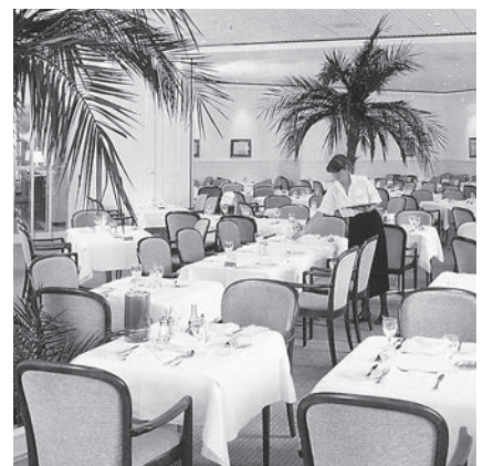
Der Palmensaal im klassischen Design anno 1988