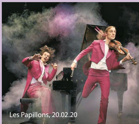
Les Papillons, 20.02.20