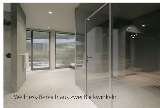
Wellness-Bereich aus zwei Blickwinkeln