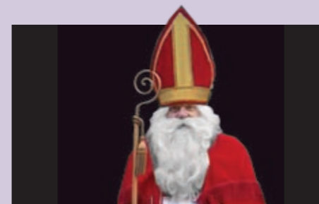
SAMICHLAUSBESUCH SO 9.12.12 // 15 UHR PALMENZAAL