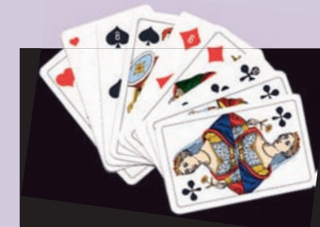
BEWOHNERJASSEN JEDEN MI // 14.45 UHR