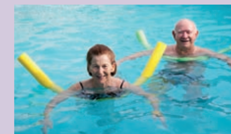
WASSERGYMNASTIK JEDEN DO // 10 UHR