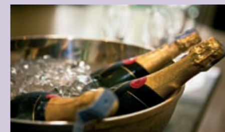
JAHRESENDAPÉRO FR 28.12.12 // 16 UHR PALMENZAAL