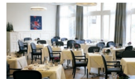
Der helle Raum und das moderne, gemütliche Ambiente laden zum Verweilen ein.

Der Palmensaal ist als gemütliches Bewohnerrestaurant und Lokalität für verschiedenste Anlässe das Herzstück unserer Residenz. 2011 wurde er vollständig renoviert. Ein neuer, schöner Parkettboden in geölter Eiche ist ein reizvoller Blickfang und zudem ideal für Tanzanlässe wie das beliebte Dîner dansant des Restaurants Arcadia. Die bestehenden Lampen wurden durch ein modernes Beleuchtungskonzept ersetzt. Die gediegenen Leuchtkörper erlauben vielfältige, den Verhältnissen optimal angepasste Beleuchtungsmöglichkeiten. Zudem wurden die Stühle neu bezogen und neue Vorhänge angebracht. Mit seinen Unterteilmöglichkeiten, einer modernen Audioanlage sowie Leinwand und Projektor ist der Saal flexibel für verschiedene Anlässe, zum Beispiel Bankette, Konzerte und Vorträge, nutzbar. Als Dekoration dienen sechs Originalbilder der bekannten Künstler Barbara Ellmerer und Alois Lichtsteiner.