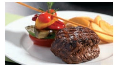
Herrlich zartes Black-Angus-Biobeef in den exquisiten Kreationen unserer Köche.

zertifiziertem Weidegras. Rinder und Weiden sind garantiert frei von jeglicher Chemie und genveränderten Organismen. Wir beziehen für unsere Küche die besten Stücke wie Filet, Entrecôte und Huft von Ojo de Agua. Das zarte Black-Angus-Biobeef ist erste Wahl und hat bei Topgastronomen und Kritikern einstimmige Anerkennung gefunden.