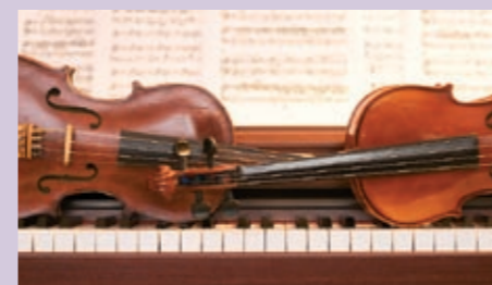
KONZERT TRIO PAPIILLON MO 8.10.12 // 15 UHR PALMENZAAL