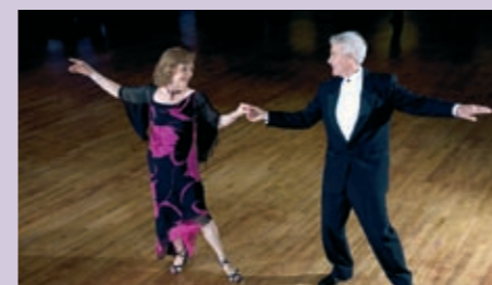
MUSIKALISCHE UNTERHALTUNG MIT MR. EVERGREENS MO 17.9.12 // 15 UHR PALMENZAAL MO 12.11.12 // 15 UHR PALMENZAAL