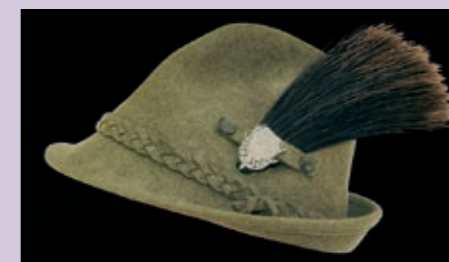
ABENDESSEN HERBSTANLASS MI 10.10.12 // 18.30 UHR PALMENZAAL